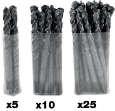
x5 x10 x25