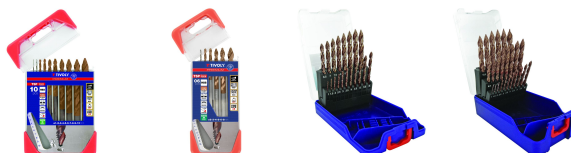
10 forets métaux HSS taillé meulé revêtus FUSIO affûtage Tivoly Smart Point Ø 1 à 10mm