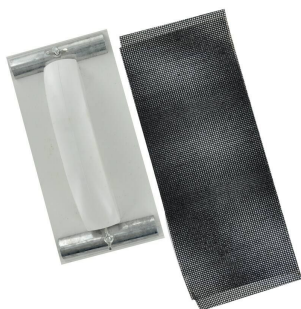
1 cale Ø 230 x115mm + 2 treillis GR120

Cale à poncer rigide 70x125mm. Ponçage rapide et uniforme sur bois et métaux.